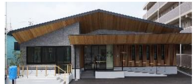
新館 令和3年4月開所